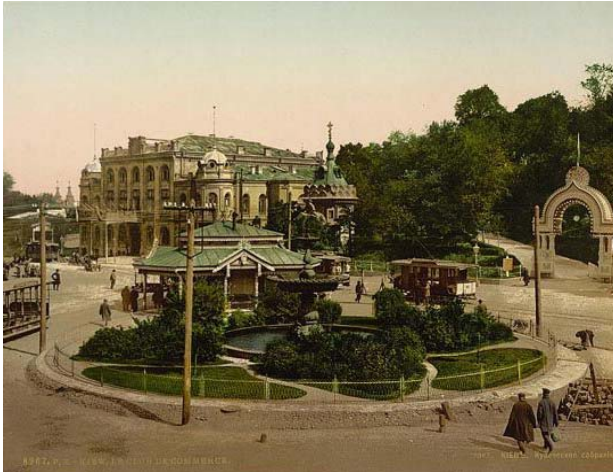
Будинок Купецького зібрання. Кін. XIX ст. Європейська площа.