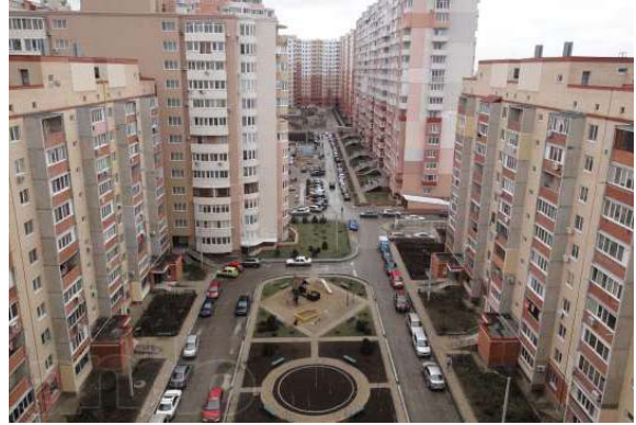
Спальні райони Одеси.

[Електронний ресурс]. — Режим доступу: http://odessa.od.slando.ua .