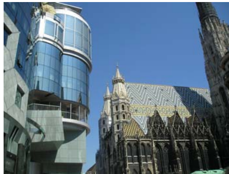
Центр Відня (Австрія).