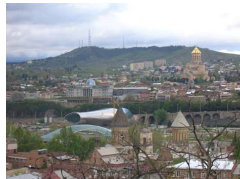
Центр Тбілісі (Грузія).