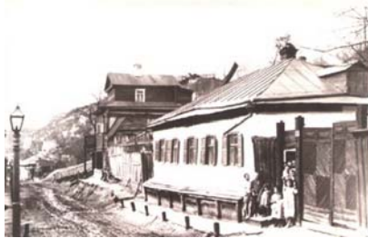
Вул. Петровська на Подолі в Києві, 1879 р.