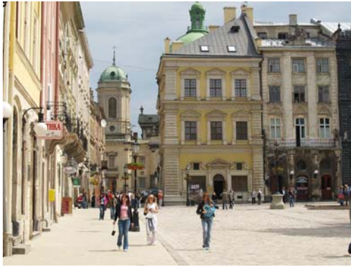
Центральна частина Львова.