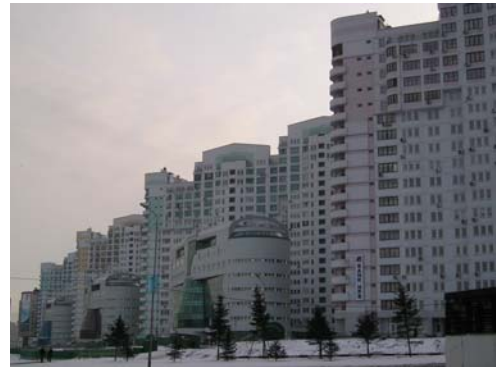
Сучасні спальні райони Києва.

[Електронний ресурс]. — Режим доступу: http://geografica.net.ua/photo/kraevidi_ukrajini/misto_kijiv/19-2-0-0-2 .