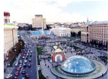
Майдан Незалежності, 2004 р.

Майдан Незалежності (площадь Независимости) в Киеве — история в фотографиях и его будущее глазами нового архитектора Киева [Електронний ресурс]. — Режим доступу: http://www.archdesignfoto.com/majdan-nezalezhnosti-ploshhad-nezavisimosti-v-kieve-istoriya-v-fotografiyax-i-ego-budushhee-glazami-novogo-arxitektora-kieva.html .