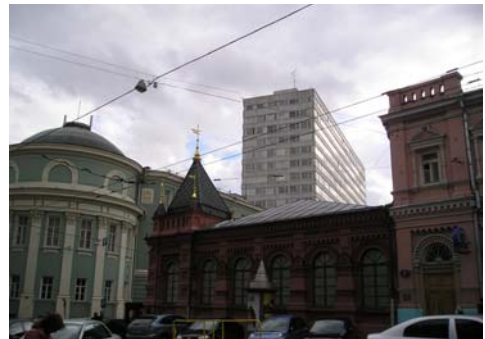
Центр Москви (Росія).