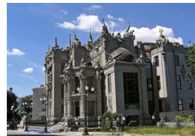
Будинок В. Городецького, 1901–1904 рр.