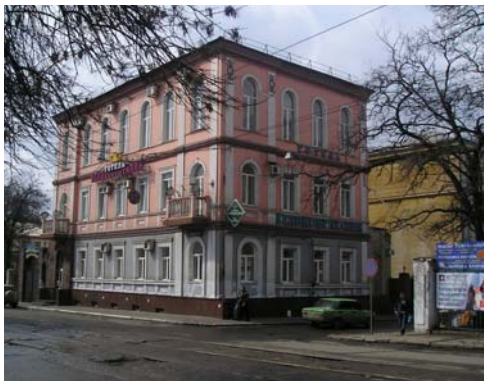
Старий центр Донецька.