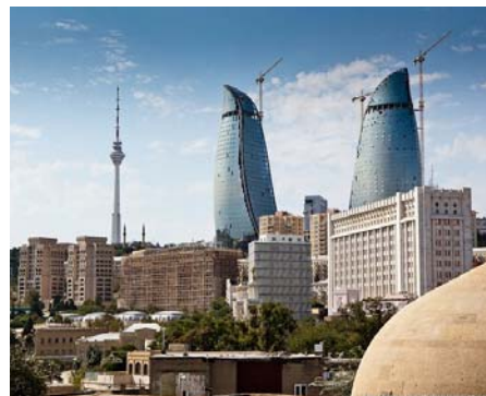
Центр Баку (Азербайджан).