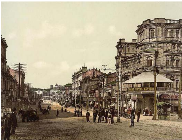
Вид на Хрещатик та будівлю Гранд-готелю від Бессарабської площі, поч. XX ст.

[Електронний ресурс]. — Режим доступу: http://starozhitnosti.kiev.ua/313-evropeyskaya-ploshchad.html .