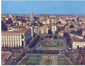
Площа Калініна, 1960-ті рр.