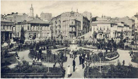
Думська площа, 1910-ті рр.