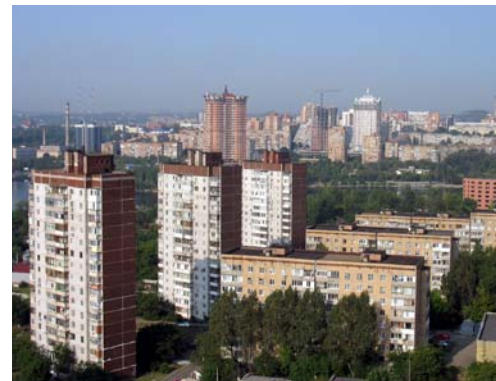
Спальні райони Донецька радянського часу.