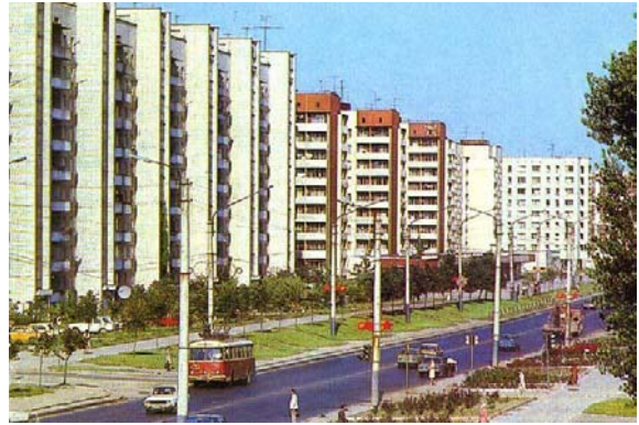
Вул. Артема у Львові, 1980-ті рр. (нині — вул. Володимира Великого).