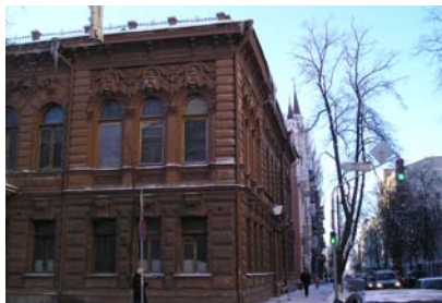
Будинок М. Ковалевського, 1911–1913 рр.