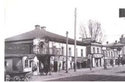
Вул. Межигірська на Подолі в Києві, 1901 р.