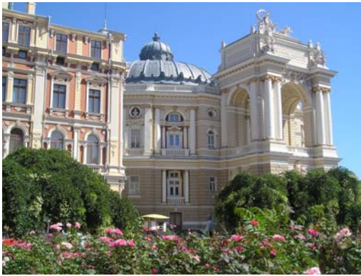
Центральна частина Одеси.