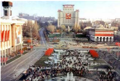
Площа Жовтневої Революції, 1981 р.