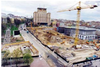
Майдан Незалежності, 2001 р.