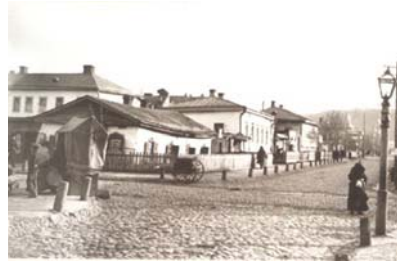
Вул. Ярославська на Подолі в Києві, 1901 р.