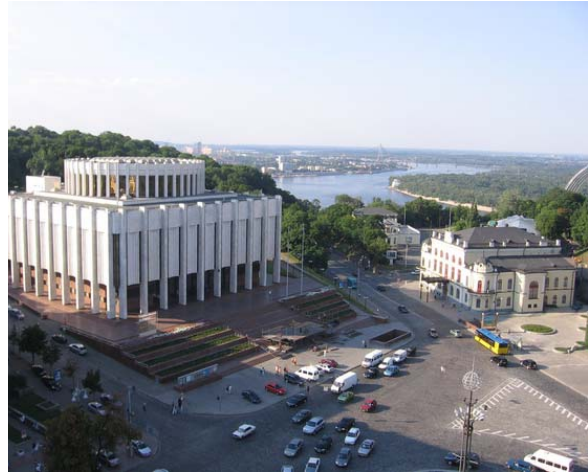
Європейська площа. Сучасний вигляд.

[Електронний ресурс]. — Режим доступу: http://starozhitnosti.kiev.ua/313-evropeyskaya-ploshchad.html .