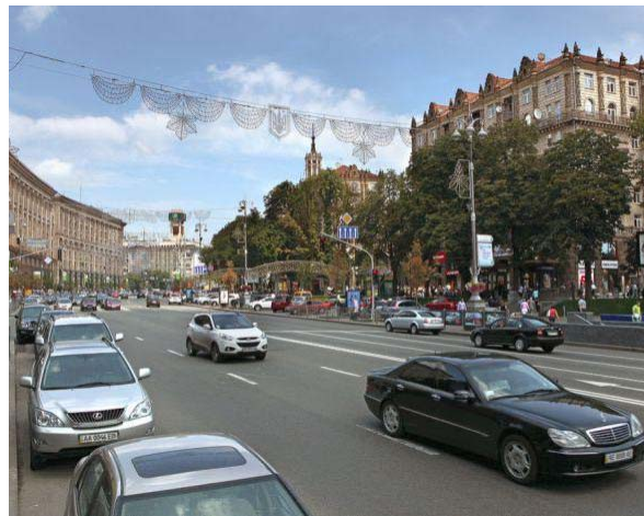
Сучасний вид на Хрещатик від Бессарабської площі.

[Електронний ресурс]. — Режим доступу: http://retrobazar.com/journal/photo/583_foto_kieva_v_proshlom_i_segodnja.html .