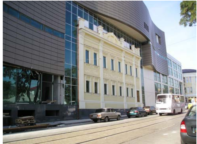
Донецьк, торговельно-офісний центр "Green Plaza".