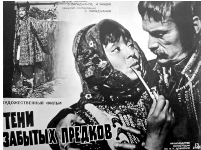
Перша афіша фільму «Тіні забутих предків», 1965 р.

Попович М. Культура. Ілюстрована енциклопедія України. — К.: Балтія-Друк, 2009. — С. 180.