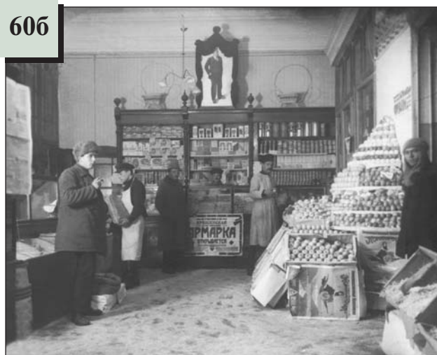
Внутрішній вигляд магазину в Києві у 1926–1927 рр.

6. Розгляньте рекламне оголошення (джерело 59). Підготуйте характеристику державного тресту «Хімвугілля» за такими показниками: а) основні реквізити тресту (адреса, інформація про керівництво); б) підприємства та організації, що входять до тресту; в) виробнича діяльність тресту; г) потреби тресту.