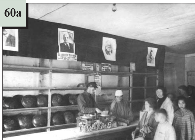
Внутрішній вигляд магазину в Києві у 1924 р.