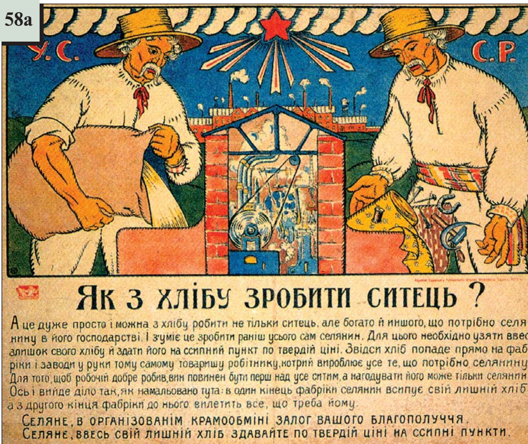
Радянський плакат. 1920 р.