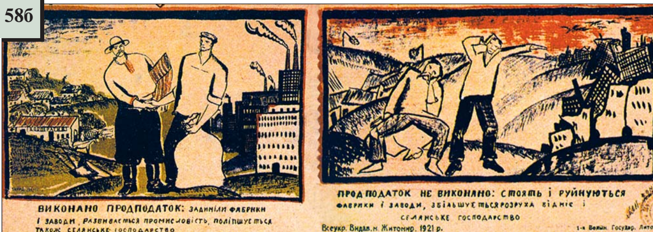
Радянський плакат. 1921 р.

5. Роздивіться уважно плакати 58a–586. Зверніть увагу на дати їх створення. Перечитайте текст. Знайдіть спільне і відмінне. Спробуйте визначити різницю між продрозкладкою і продподатком (можливо вам допоможе текст першого плаката).