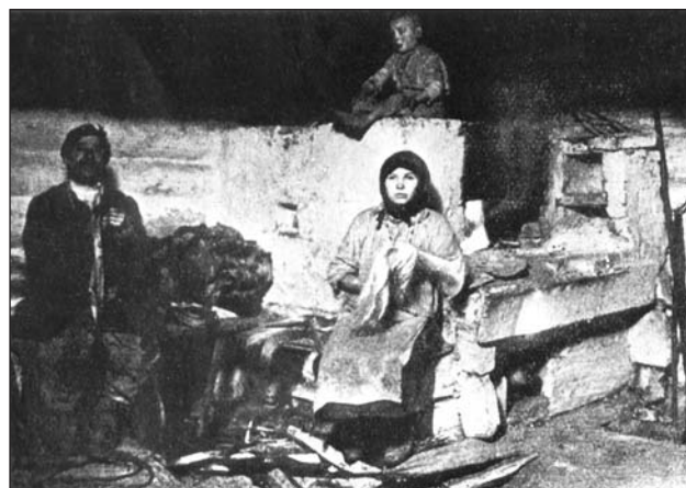
Курна хата. Рівненщина