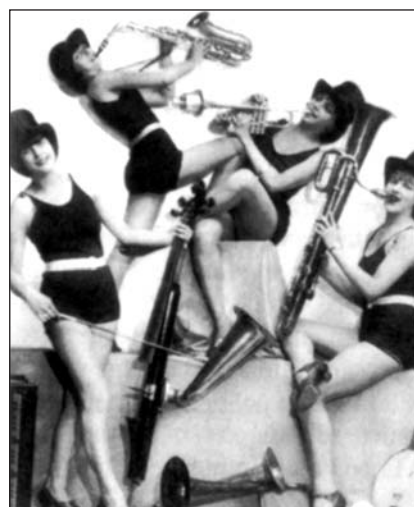
Жіночий оркестр. Німеччина.