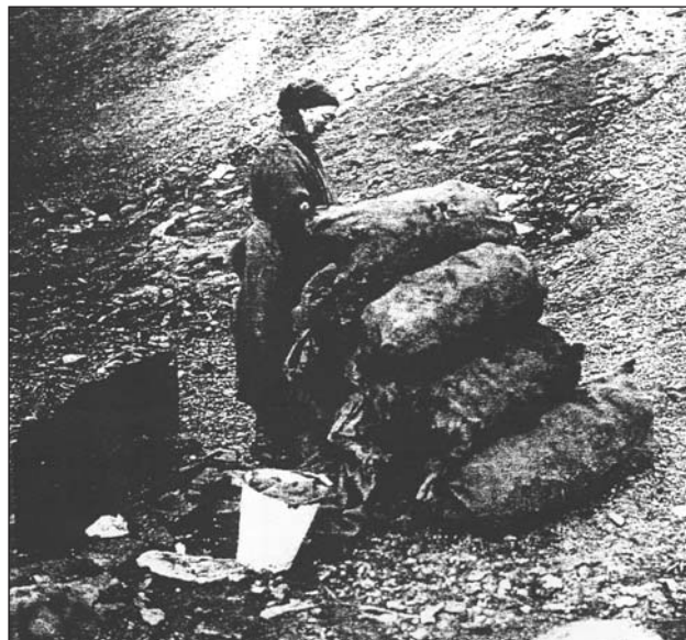
Жінка збирає вугілля на березі моря. Шотландія