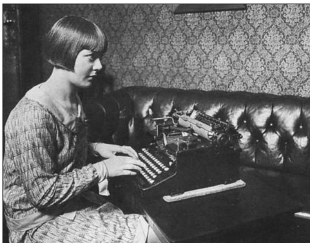
Жінка-друкарка. Німеччина, 1925 р.