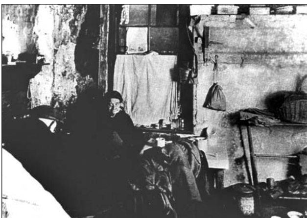
Стара жінка. Шотландія, 1929 р.