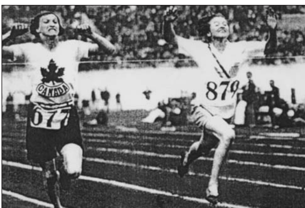
Елізабет Робінсон з команди США (праворуч) стає першою олімпійською чемпіонкою в бігу на 100 м. Амстердам, 1928 р.