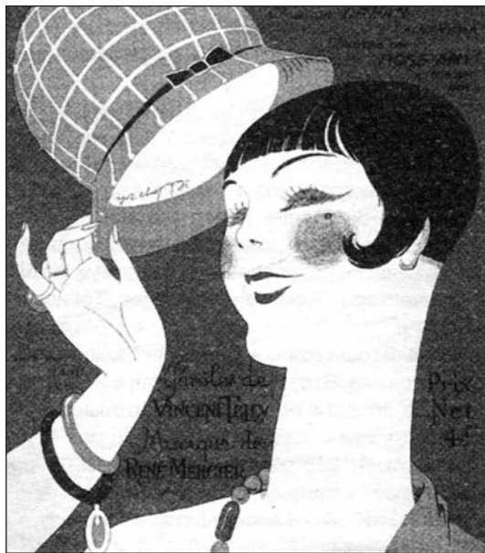
Жінка часів непу