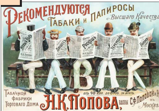
Реклама тютюнових виробів московської фабрики Н.К. Попова. Російська імперія, початок ХХ ст.