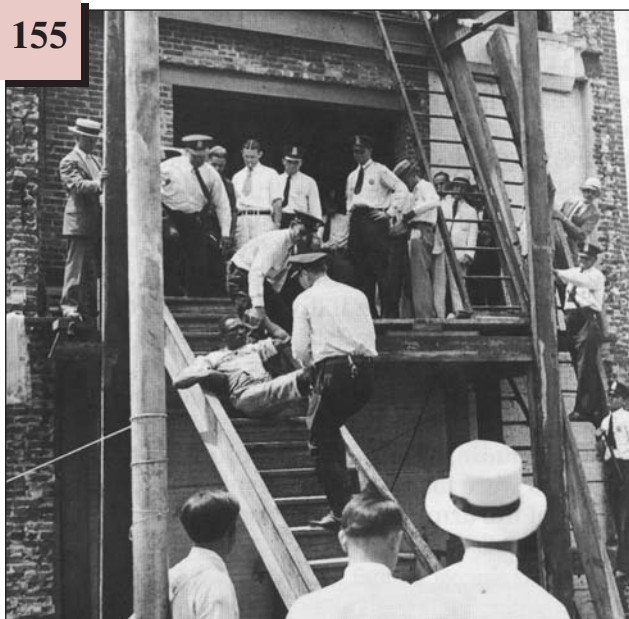
Виселення боржників з будинку. США, 1930-ті рр.