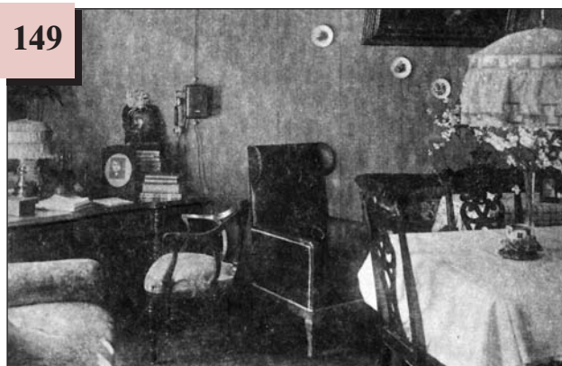
Нова квартира передового радянського робітника, який до цього мешкав у кімнаті 12 кв. м з сім'єю у 8 осіб