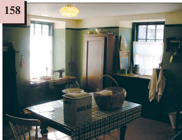
Типове помешкання родини шотландського робітника. Нью Ленарк. Шотландія, 1930-ті рр.