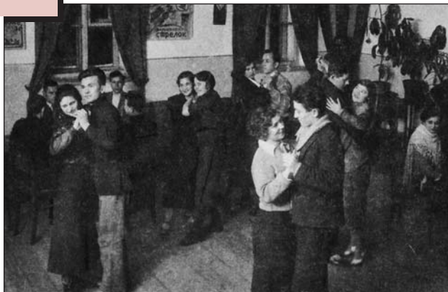
У кімнаті відпочинку