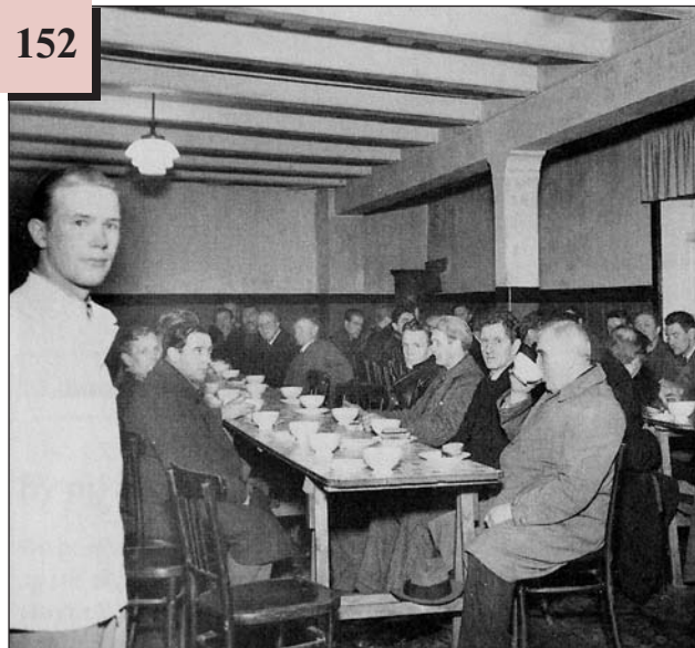
Роздача безкоштовного супу у громадській їдальні. США, 1930-ті рр.