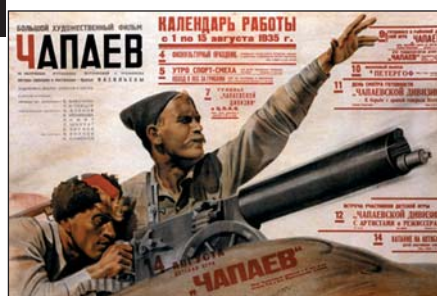
Плакат Бельського А.П. до фільму «Чапаєв»