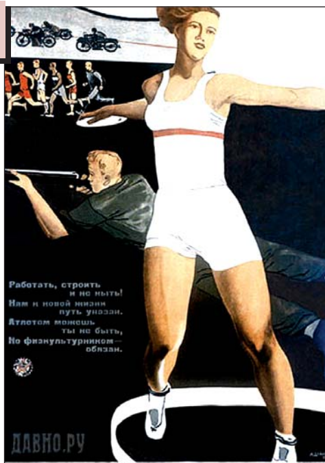
Плакат А. Дейнеки з пропагандою фізкультури і спорту. СРСР, 1930-ті рр.