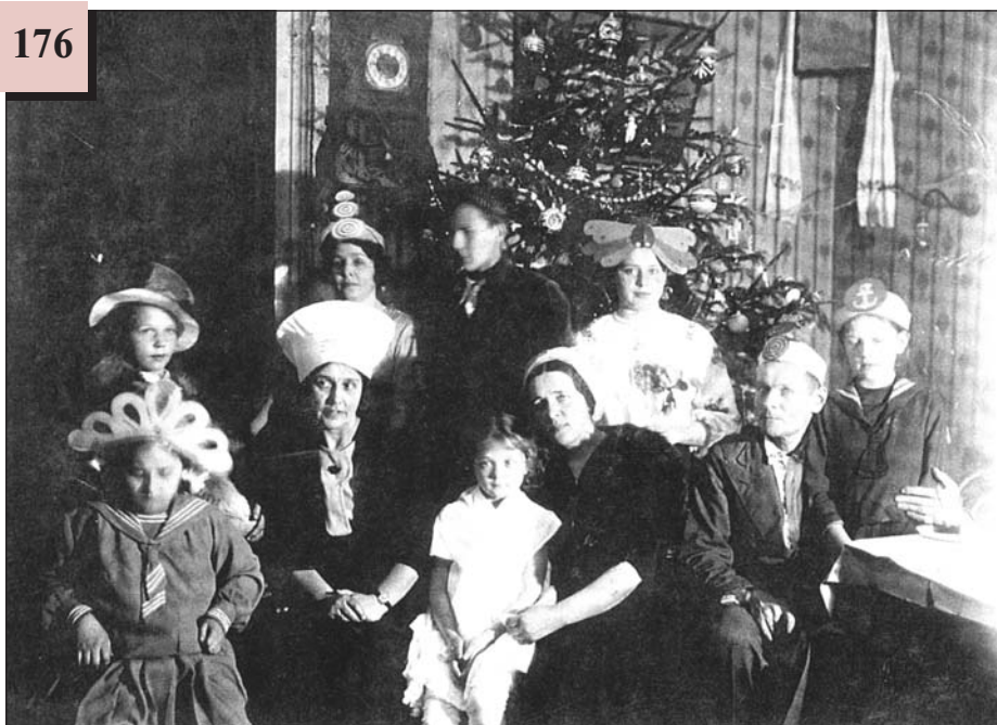
«Святкування Нового року»

27. Що зображено? З якими почуттями пов'язане у вас це свято?