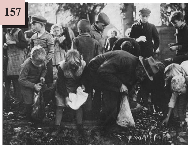
Люди порпаються у смітнику. Німеччина, 1930-ті рр.