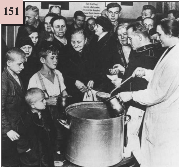
Роздача супу безробітним німцям. 1930-ті рр.