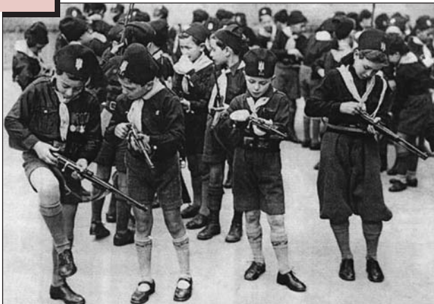
Юні члени італійської «Баллі» («Юні фашисти»). Рим, Італія.