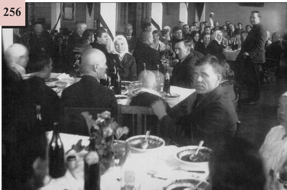
Святковий обід ударників заводу ім. Петровського. Дніпропетровськ, 1936 р.