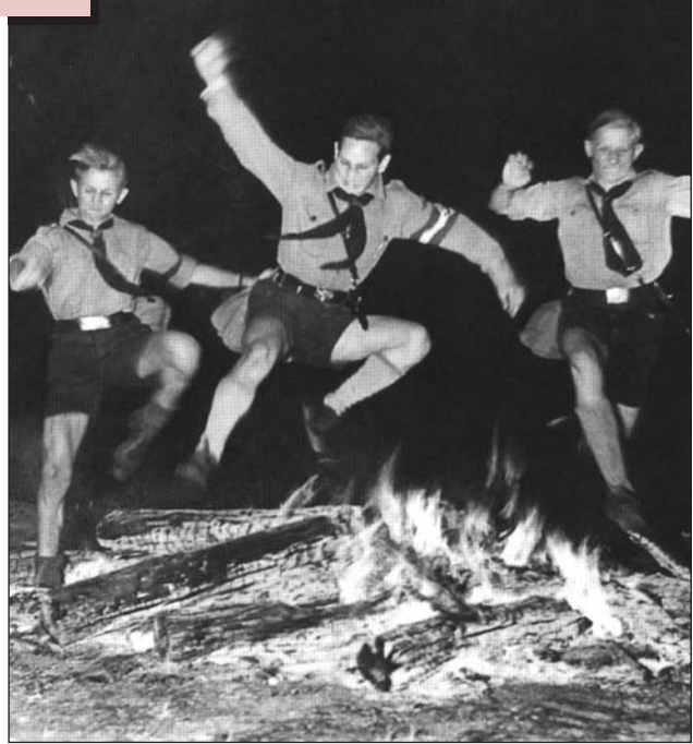
Фестиваль у літньому таборі для «Гітлерюгенд»