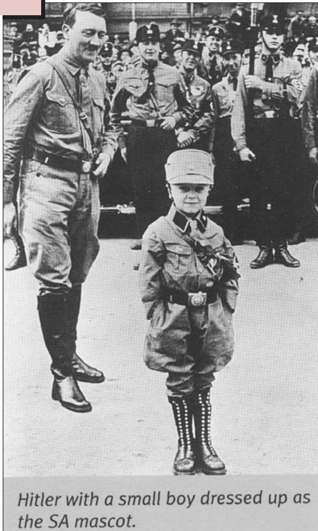
Hitler with a small boy dressed up as the SA mascot.