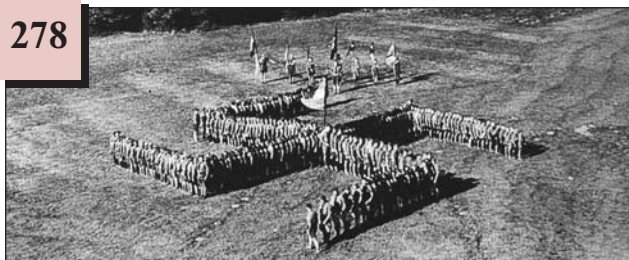
Спортивні вправи. Німеччина, 1930-ті рр.