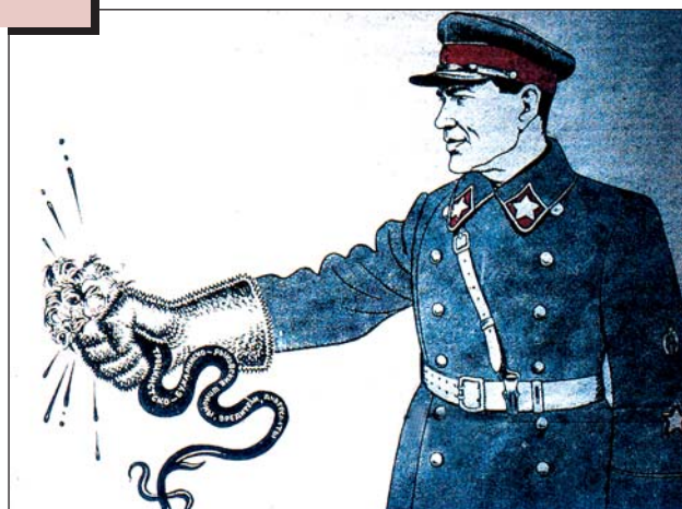
Радянський плакат «Ежовые рукавицы»

http://www.gendercide.org/case_stalin.html