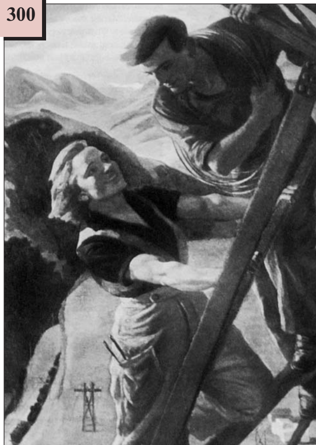
Полотно радянського художника «Все вище і вище!» 1930-х рр.