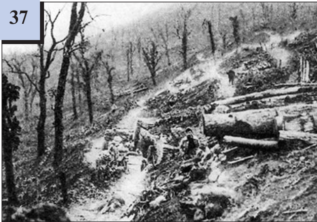
Після битви під Верденом