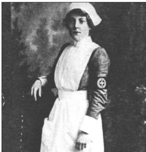
Жінка-медсестра часів війни