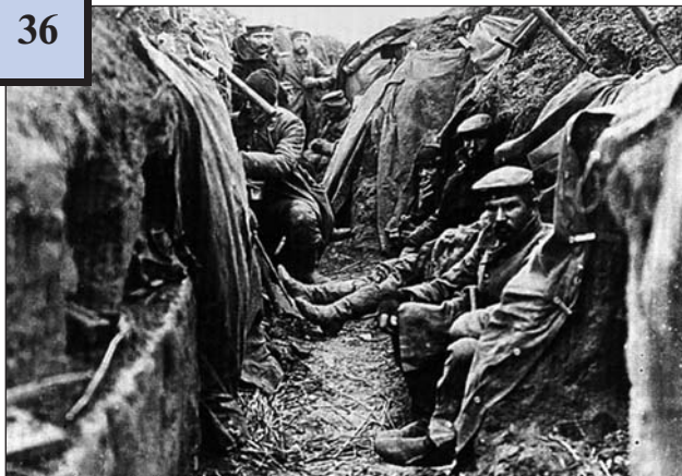
Передова лінія на Західному фронті