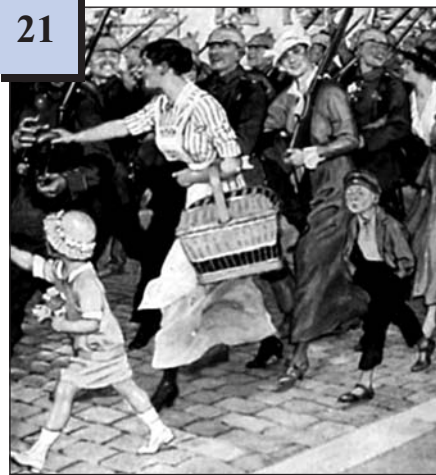
Прощання з солдатами. Поштова листівка. Франція, 1914 р.