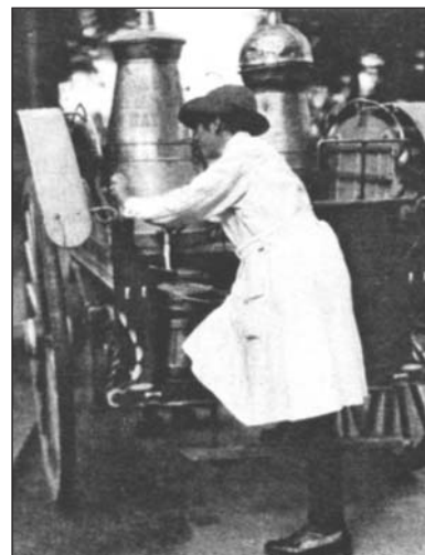
Жінка розвозить молоко