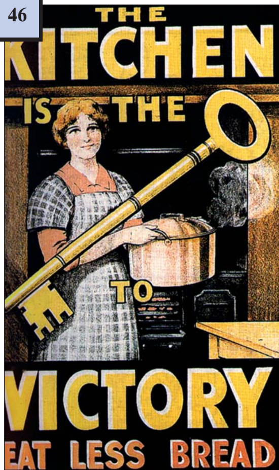
Англійський плакат часів Першої світової війни «Кухня – ключ до перемоги (Їж менше хліба)»