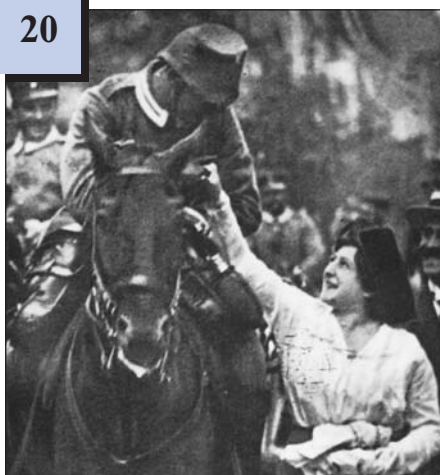
Прощання з солдатами. Берлін, серпень 1914 р.