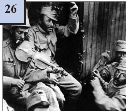
Австрійські солдати їдуть на фронт