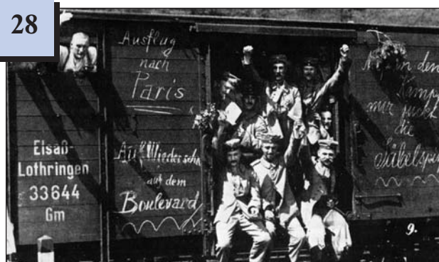
Німецька армія перед відправкою на фронт. 1914 р.