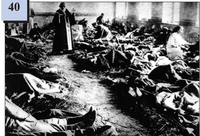
Польовий шпиталь (російська армія)