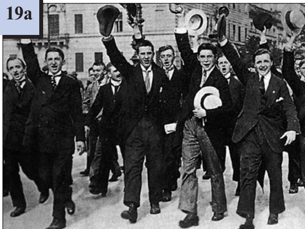
Демонстрація в Берліні в перші дні війни