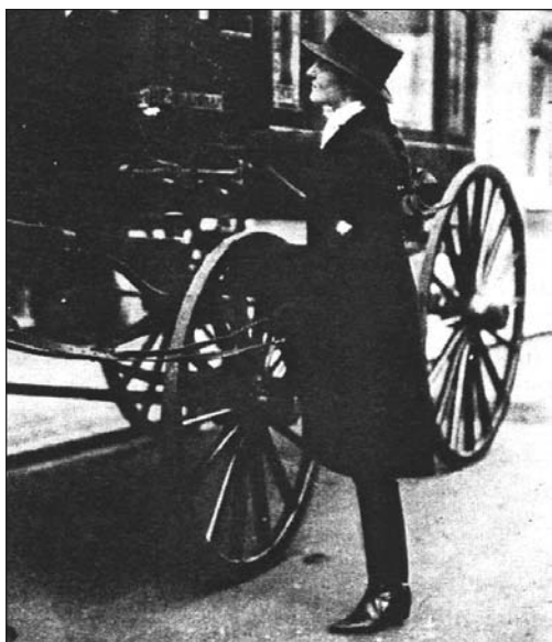
Співробітниця похоронного бюро