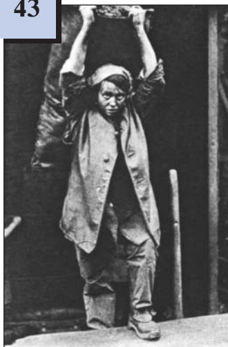
Жінка носить вугілля