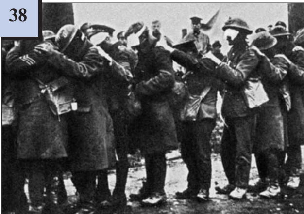
Солдати після газової атаки. 1915 р.