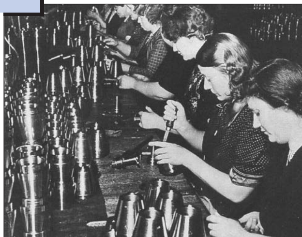
На фабриці гранат. Німеччина, 1917 р.