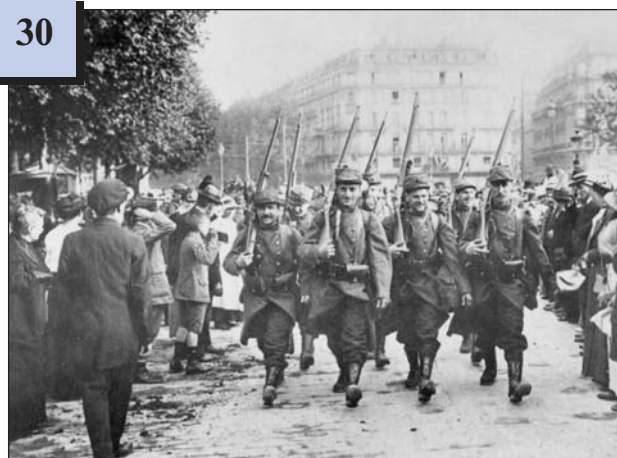
Французькі солдати відправляються на фронт. Серпень 1914 р.