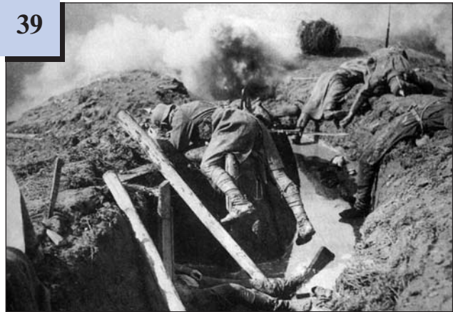
Убиті німецькі солдати в окопах. 1916 р.