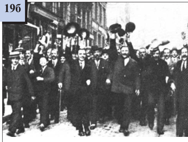
Демонстрація у Парижі в перші дні війни