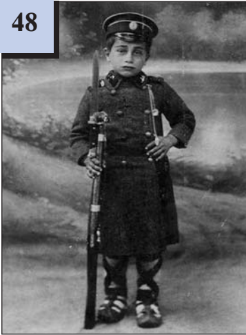
Сербський хлопчик у військовому вбранні