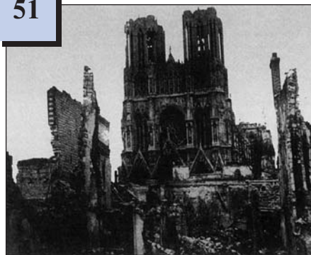
Зруйнований під час Першої світової війни Реймський собор