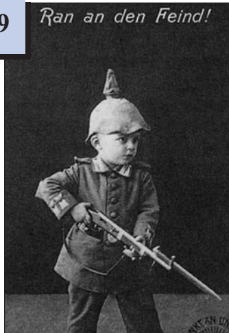
Німецька листівка: «Біжи на ворога!»

6. Чим і чому подібні джерела 48 і 49? Зверніть увагу: одне з них походить з країни Антанти, а друге – Четверного блоку. Як ви думаете, чому діти з'являються на листівках і фотографіях з атрибутами війни? Яку роль виконували такі зображення?