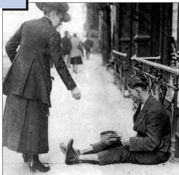
Милостиня інваліду війни. Німеччина