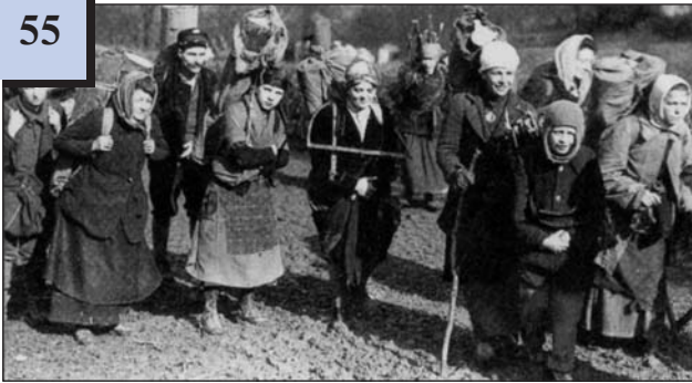
Мешканці Відня збирають дрова. Австрія, 1918 р.