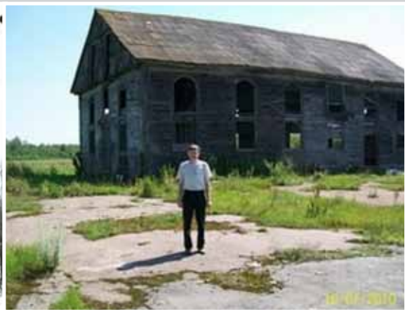
Німецька церква в с. Сорочень Житомирської області Світлина ліворуч — 1920 р, світлина праворуч — 2010 р.

Режим доступу : http://drevlyaniya.blogspot.com/2010/12/blog-post.html