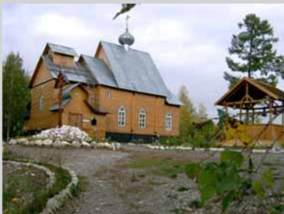
Українська церква у селищі Новий Ургал, Хабаровський край, Російська Федерація

[Електронний ресурс]. — Режим доступу: http://bam.railways.ru/history.html