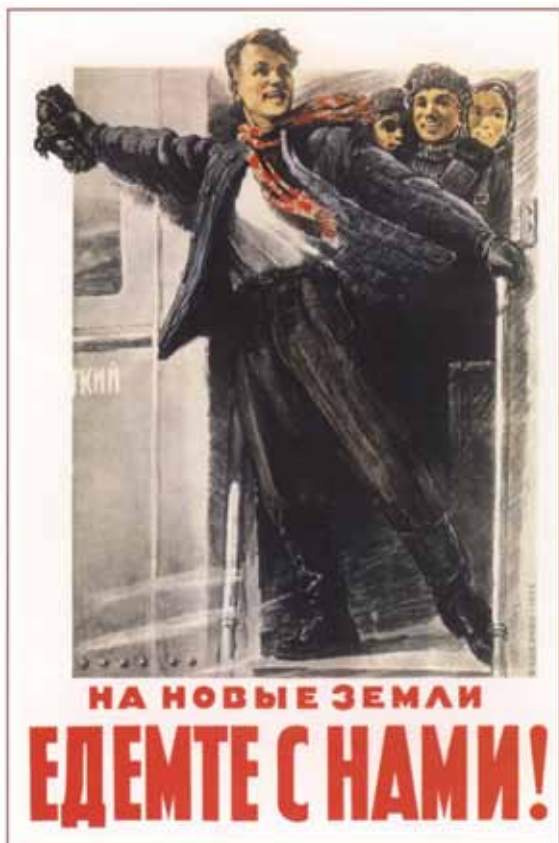
Селезньов В. «На нові терени їдьмо з нами!» 1954 р.