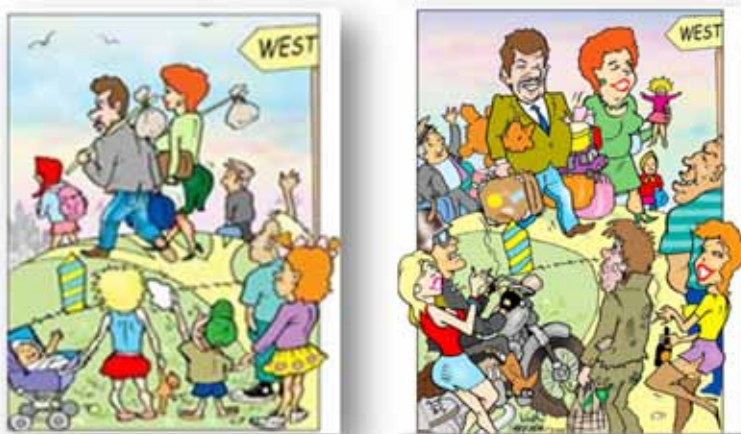
Карикатури Вадима Шевченка

[Електронний ресурс]. — Режим доступу: http://kobza.com.ua/content/view/2342/