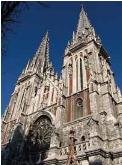
Костел Св. Миколая, м. Київ, 1899–1909

Нічик В. М., Хижняк З. І. Києво-могилянська академія та українсько-німецькі культурні зв'язки // Наукові записки. Том 18 «Історичні науки». — НАУКМА. — Київ: Academia, 2000. — С.12–30.