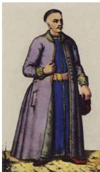
Міщанка і міщанин, Київ, XVIII ст.

Летописное повествование о Малой России и ея народе и козаках вообще. Собрано и составлено чрез труды...Александра Ригельмана 1785–86 года. — Москва, 1847.