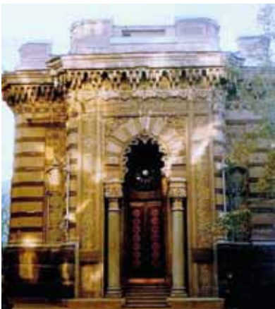
Караїмська кенаса, м. Київ, 1898–1902

[Електронний ресурс]. — Режим доступу: http://www.kievtown.net/ukr/sights/sofiyevsky.html .