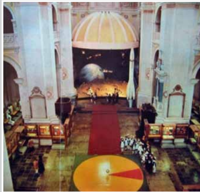
Інтер'єр Волинського обласного музею атеїзму у приміщенні римо-католицького костелу Петра і Павла. м. Луцьк. 1980-ті роки

[Електронний ресурс]. — Режим доступу: http://www.ivfrankivsk.if.ua