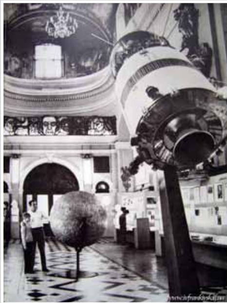
Інтер'єр музею релігії та атеїзму у приміщенні вірменського костелу. м. Івано-Франківська 1980-ті роки