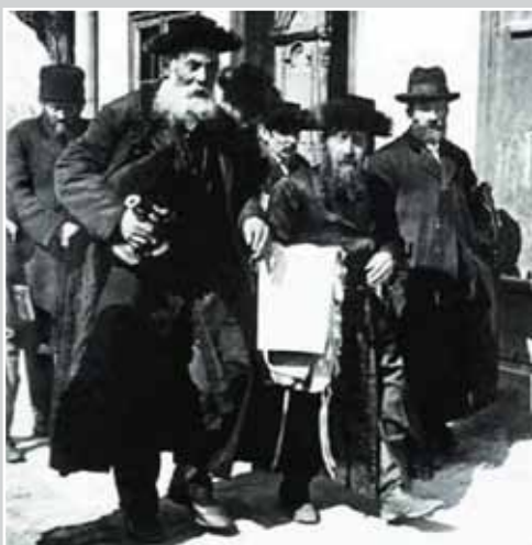
Повернення додому із синагоги.