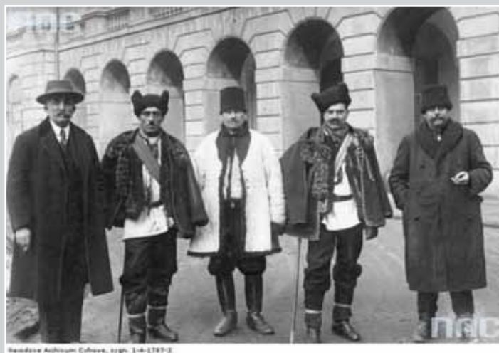
Делегація гуцулів у віце-прем'єра Казімежа Бартеля (1 березня 1927 р.)