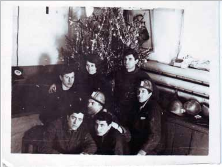
Працівники електричного цеху хімічного підприємства в останній робочий день напередодні Нового 1973 року