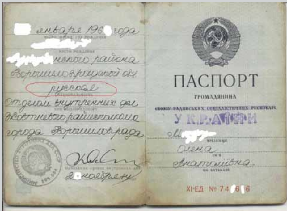
Паспорт радянської громадянки М. Олени Анатоліївни

[Електронний ресурс]. — Режим доступу: http://za.zubr.in.ua/2010/03/11/5021/