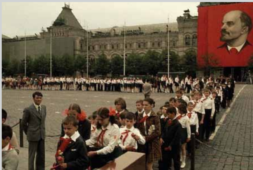
1975 р. Москва. Піонери відвідують мавзолей В. І. Леніна.