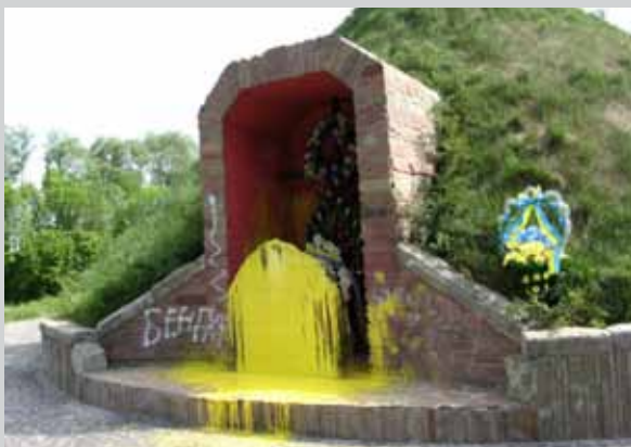
Фрагмент меморіалу битви під Крутами 1918 р. відкритого 25 серпня 2006 р. у с. Пам'ятне Чернігівської обл. Наслідки акту наругу 21 травня 2007 р.

[Електронний ресурс]. — Режим доступу: http://uk.wikipedia.org/wiki/Меморіал_пам'яті_героїв_Крут