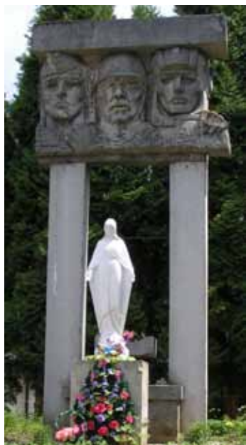
Пам'ятник воїнам радянської армії у с.Славське Львівської обл.

Наприкінці 1980-х — на початку 1990-х років, в умовах розпаду СРСР заборонена пам'ять про підпілля та репресії вийшла на поверхню і стала одним із символів дерадянізації міського та сільського простору Галичини і Волині. Саме у цих двох регіонах за ініціативою місцевих громад почалося масове встановлення пам'ятників воїнам УПА та провідникам націоналістичного руху, насамперед, Степанові Бандері. Пострадянська канонізація Бандери є прикладом зовнішнього розриву з радянським ідеологічним каноном (в якому Бандера був головним антигероєм). Але за стилістикою виконання монументи Бандери дуже нагадують пам'ятники радянським генералам або героям-комсомольцям: постамент високий, герой — зосереджений і певний себе, його слава — безсумнівна <...> Проте у Галичині, поруч із масовим зведенням меморіалів націоналістичному підпіллю, пам'ятники радянським солдатам не демонтували й не піддавали вандалізму. Їхня дерадянізація та адаптація до нових умов нерідко відбувалася шляхом добудови скульптури Божої Матері, яка оплакує полеглих.