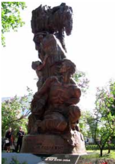
Пам'ятник «Жителям Луганщини, загиблим від рук карателів-націоналістів з ОУН-УПА», відкрито в Луганську 8 травня 2005 р. Автори М. Можаяєв, В. Голенко, В. Тихонов