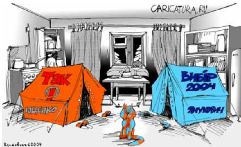
Політична карикатура передвиборчої президентської кампанії 2004 р. Автор О.Кустовський