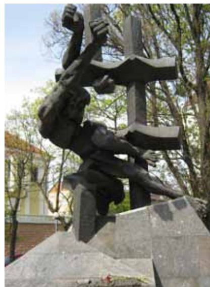
Пам'ятник «Жертвам комуністичних злочинів», відкрито у Львові 8 листопада 1997 р. Автори П. Штаєр, Р. Сивенький