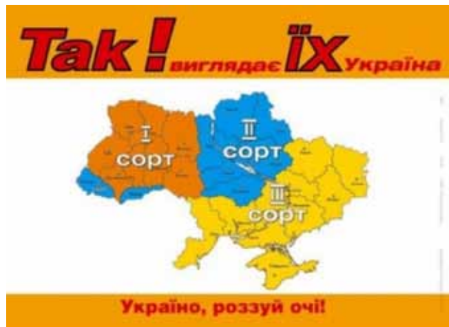
«Чорний PR» передвиборчої президентської кампанії 2004 р.