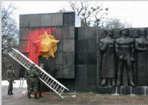
Фрагмент Монуумента слави «Переможцям над фашизмом», відкритого у Львові у 1970 р. Наслідки акту наругу 8 грудня 2010 р.

[Електронний ресурс]. — Режим доступу: http://uk.wikipedia.org/wiki/Меморіал_пам'яті_героїв_Крут