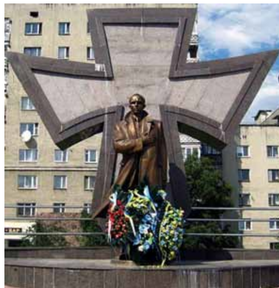
Пам'ятник С.Бандері в Івано-Франківську, відкритий 1 січня 2009 р.. Автор М.Посікіра.