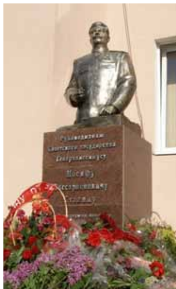
Пам'ятник Й. Сталіну у Запоріжжі, відкритий у травні 2010 р.