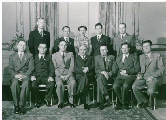
Учасники делегації УРСР на міжнародній конференції в Сан-Франціско.