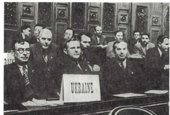
Учасники делегації УРСР на міжнародній конференції в Парижі.