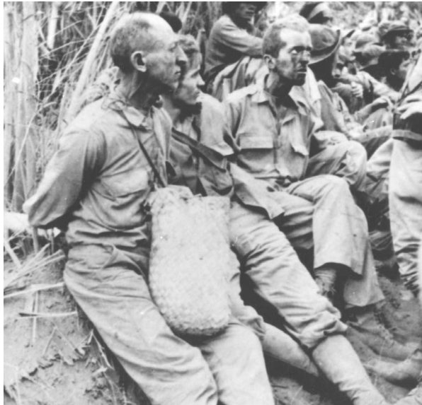
Американські та філіппінські військовополонені під час маршу смерті, коли японські війська окупували Філіппіни, травень 1942 року.

Завдання 5. Розгляньте фотографії. Знайдіть подібні та відмінні риси американських та радянських полонених. Врахуйте зовнішність, психологічний стан, умови утримання. Полонених яких армій було більше у цей період війни? Чому?